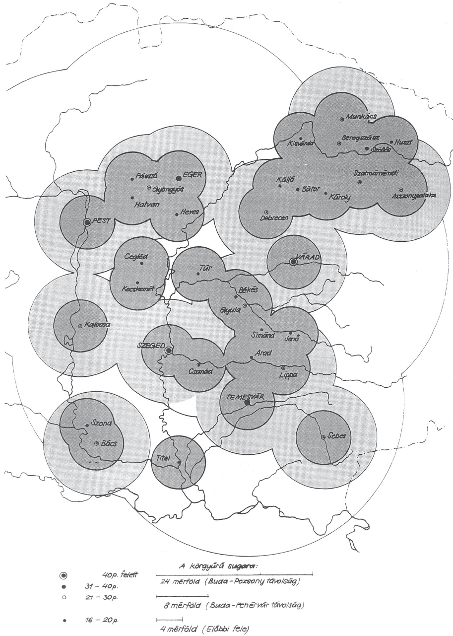
3. ábra: Városias települések az Alföldön és a piaci gyűrűk