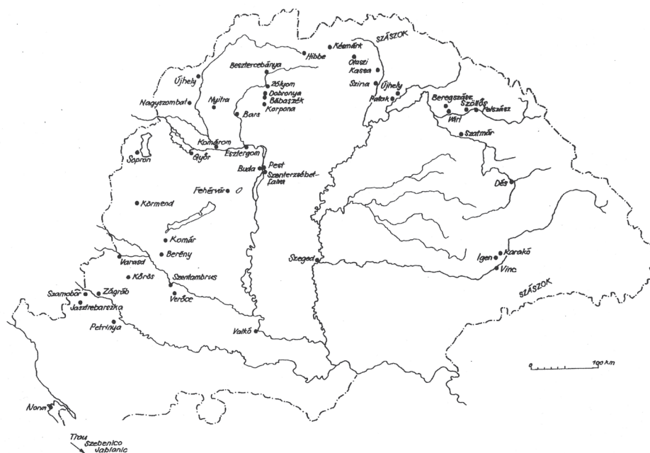
2. ábra. Királyi városkiváltságok 1272-ig

jog is. Végül beszállásolás alóli mentességet kaptak, tehát nem kellett a királyt, kíséretét, vagy a megyésispánt ellátniuk, ha közéjük ment.